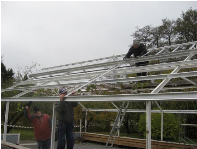
Bygget av det nya växthuset utfördes av några flitiga och skickliga medlemmar. Det tog många mantimmar att slutföra!

Allting förändras brukar jag säga, men så är det naturligtvis inte. Vi följer en urtida kalender. Januari var tillägnad den romerska guden Janus som hade ett ansikte fram och ett bak. Han kunde se framåt och bakåt och var väl en bra symbol att börja året med, när man bytte från den romerska kalendern till den julianska ca år 45 f.Kr, då januari blev första månaden på året som tidigare var mars. Numera använder vi den gregorianska kalendern.