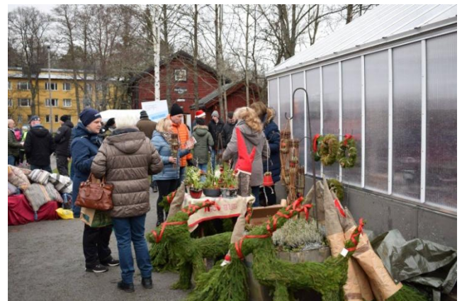
Växthuset hann bli klart lagom till julmarknaden. Det fanns många säljare och köpsugna besökare både i och utanför.

Aktivitetsprogrammet för vinter/vår 2018 är klart, se baksidan. Välkommen att delta!