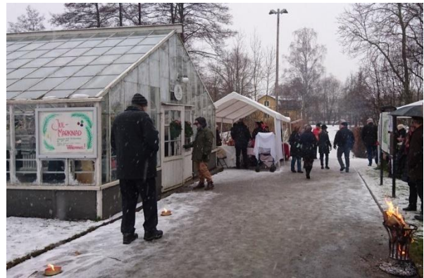
Många kom till julmarknaden trots ruskväder.

Våra aktiviteter under hösten har varit välbesökta. Handarbetsträffarna en söndag i månaden har blivit populära. Se aktivitetslistan för datum.