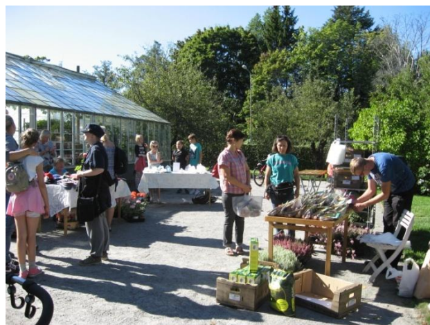
Höstmarknaden 10 september bjöd på strålande väder och det fanns blommor och hantverk både i och utanför växthuset.

Aktivitetsprogrammet för hösten/vintern är klart, se separat blad. Välkommen till våra aktiviteter! Nästa utskick kommer i februari 2017.