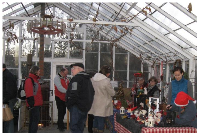
Mycket fint hantverk fanns att köpa på julmarknaden.

Våra aktiviteter under hösten har varit välbesökta. Att göra smycken av tenntråd och pärlor har intresserat många. Nu breddar vi utbudet och har "handarbetsträffar" i stället på motsvarande söndagar. Det innebär att man tar med sig det handarbete som man helst vill arbeta med, och vi lär av varandra. Se aktivitetslistan för datum.