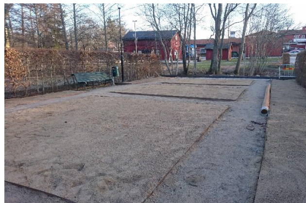
Perennrabatterna måste göras om p.g.a. sorkangrepp! Nu ligger det finmaskigt nät under alla ytorna. Det blir spännande att se vilka växter som kommer planteras där.

Trädgårdsparken håller på att rustas upp med omgjorda rabatter, nya växter och ny belysning. Lekplatsen kommer att utökas i yta och blir något utöver det vanliga. Projektet väntas bli klart under året och kanske en invigning till vår höstmarknad den 19 sept.